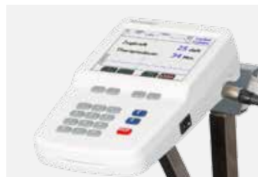
Panel de control de TRACComputer

Las variadas posibilidades de ajuste permiten adaptar la terapia individualmente de forma óptima.