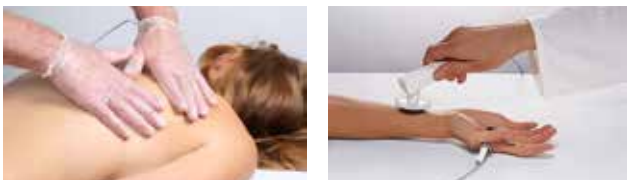
La terapia se aplica con guantes o mediante aplicador manual.

Para realizar el tratamiento, el paciente mantiene contacto con un electrodo neutro de titanio. Utilizando guantes especiales o un aplicador manual con un diseño especial (segundo contacto), se realizan movimientos rotatorios suaves sobre el tejido creando así el agradable efecto terapéutico de la oscilación profunda.